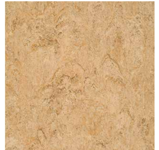
1070 Rocky Brown