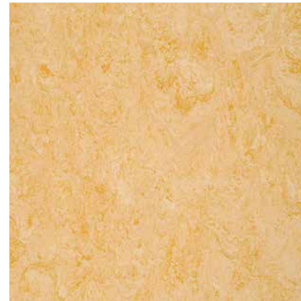
1076 Pale Yellow