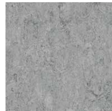
1053 Ice Grey