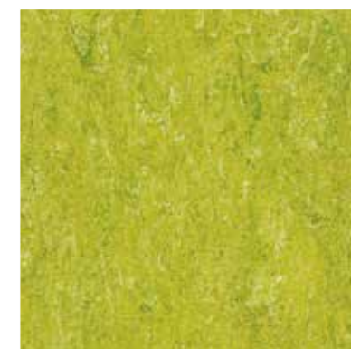
1132 Lime Green