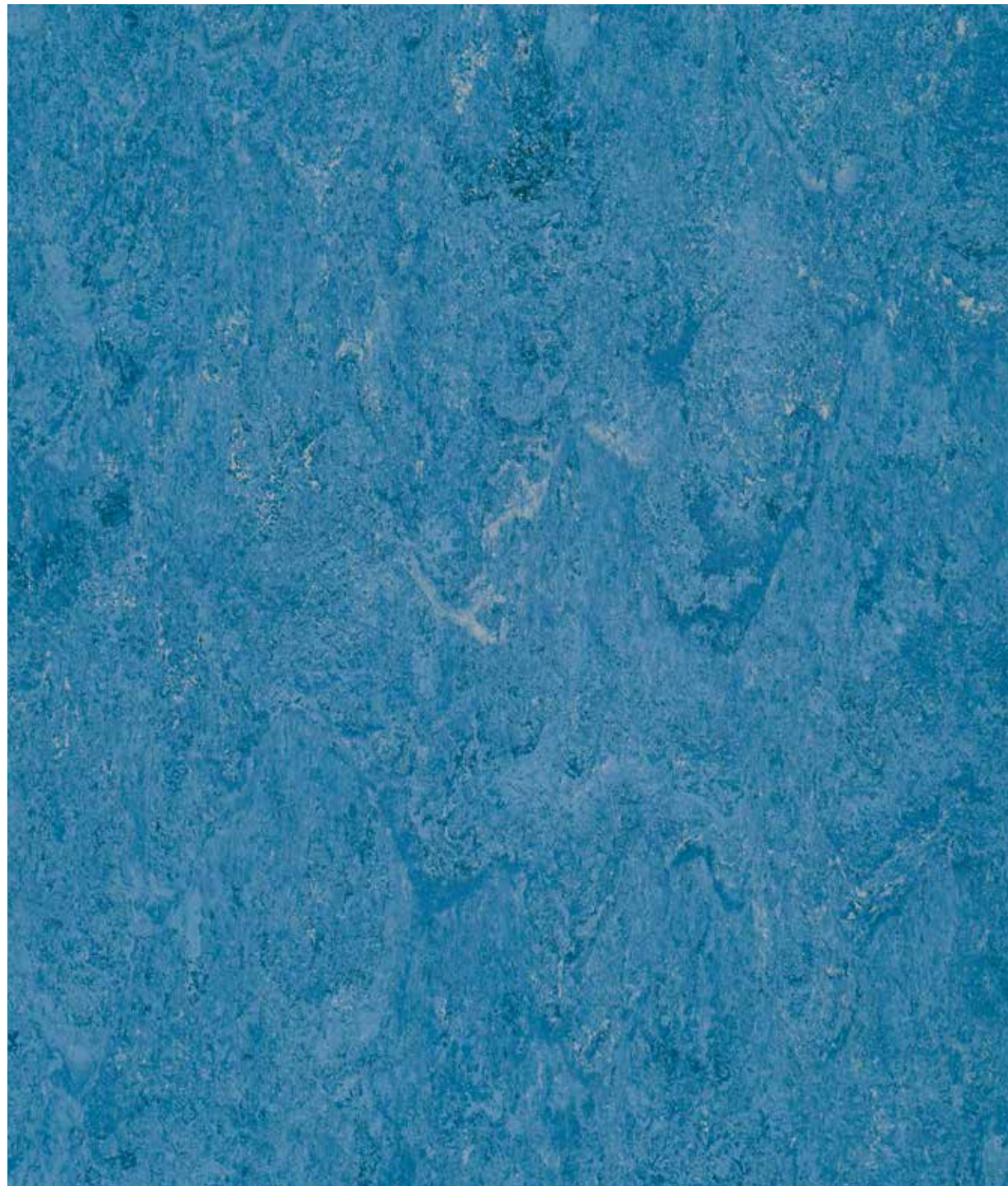
1026 Sky Blue