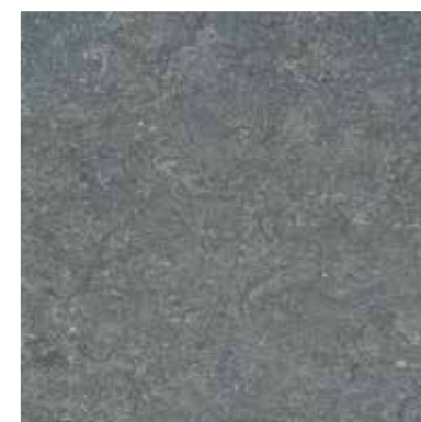
1050 Quartz Grey