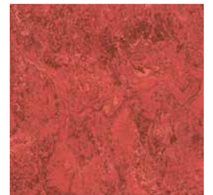
1048 Cranberry Red